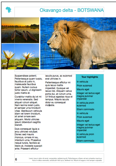
Komplex gestaltete Katalogseite mit randlosen Hintergrundbildern im Kopfteil und Hintergrundfarbe in einer der drei Textspalten im Hauptteil