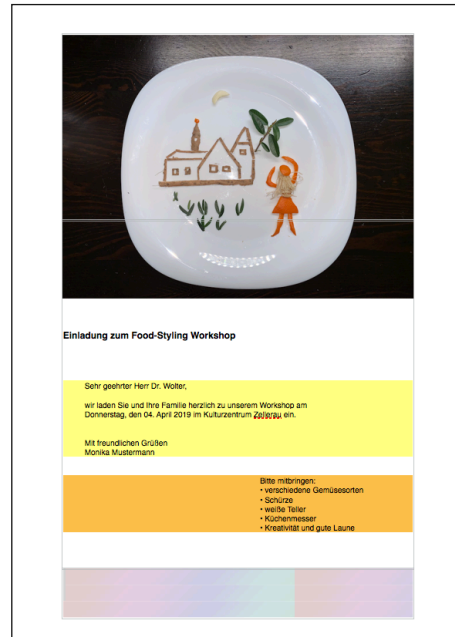
Einladungskarte mit einem Hintergrundbild im Kopfteil, zwei Textabsätzen mit verschiedenen Hintergrundfarben im Hauptteil und einem wiederholten Muster im Fußteil.