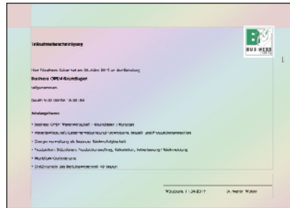
Dokument mit randlosem Muster als Hintergrund