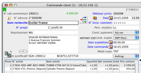
Auftragsbearbeitung in der Fremdsprache