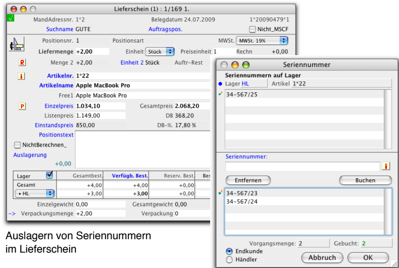
Auslagern von Seriennummern im Lieferschein