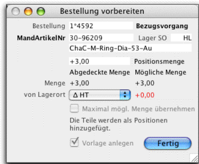
Fertigungsbestellung mit Anzeige der verwendeten Stückliste