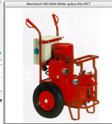
vergrößerte Darstellung mit Pfadangabe in der Kopfzeile